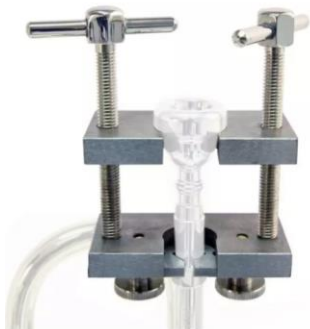
Mundstückabzieher für Blechblasinstrumente

Festsitzende Mundstücke niemals mit einer Zange, Schraubstock und dgl. lösen. Im Fachhandel gibt es entsprechende Werkzeuge, die das Instrument beim Ablösen des Mundstückes nicht beschädigen. Selbstverständlich hilft Euch auch der Fachmann aus der Instrumentenwerkstatt.