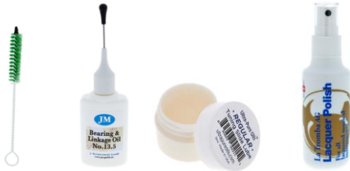
Mundstückbürste, Ventil-Öl, Zugfett, Lackpflegemittel