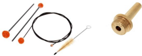
Reinigungsset für Blechbläser, Adapter für haushaltsüblichen Brauseschlauch